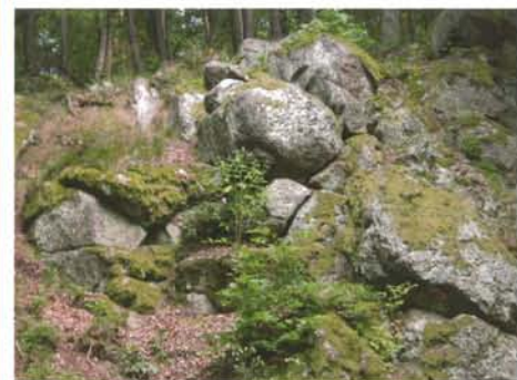
Entlang unserer Nordic-Walking-Strecken erleben Sie viel Sehenswertes wie z.B. die Wichtelsteine

Mengershof, „Klippen-Hütte“, Keseburg, Burg Hessenstein, Mengershof, Wichtelsteine ab Burg Hessenstein stetiger Aufstieg, dennoch nicht zu schwer. ca. 16 km Länge (Strecke kann nach 8,5 km abgekürzt werden)