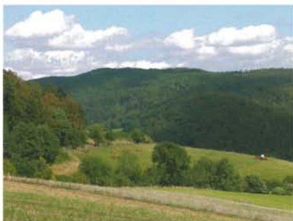
Blick vom Mengershof auf den Nationalpark

Apropos Vergnügen: Auch nach dem Fitness-Programm hält Frankenau für Sie Genussliches bereit. Wie wär's zum Beispiel mit einem netten Abend in unseren weithin bekannten Gasthäusern. Da können Sie gar nichts verkehrt machen, denn in Frankenau enden alle Gasthäuser mit „Hof“. Unsere Wirtsleute haben auch ganz sicher etwas für jeden Geschmack.