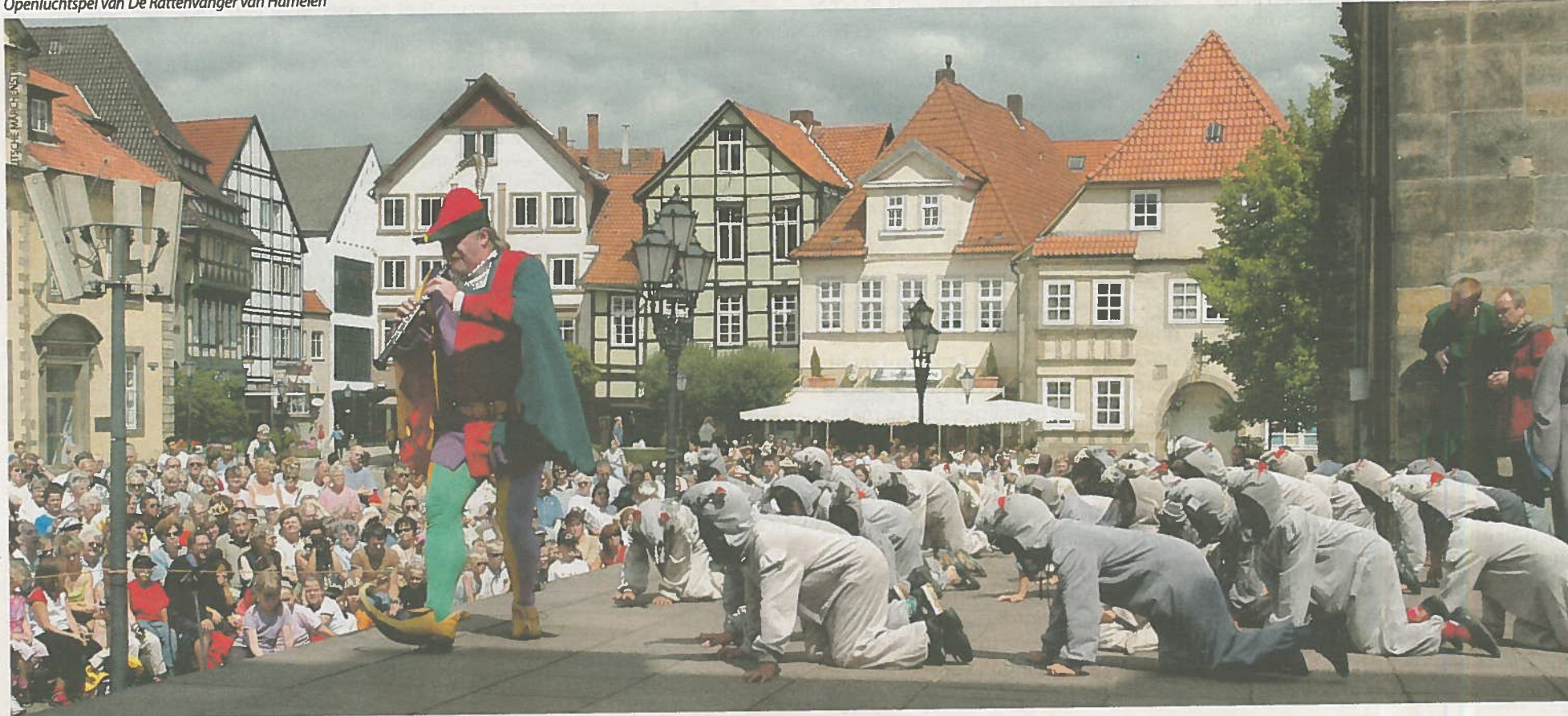
Openluchtspel van De Rattenvanger van Hamelen